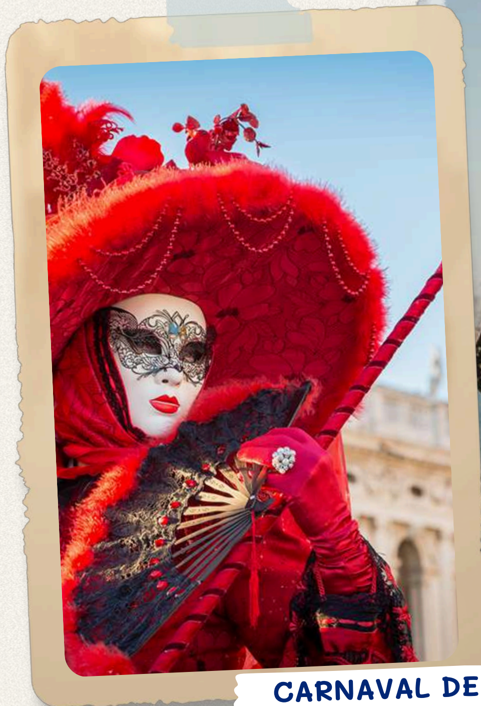
CARNAVAL DE VENISE

Participez à cet événement unique et créez des souvenirs inoubliables.