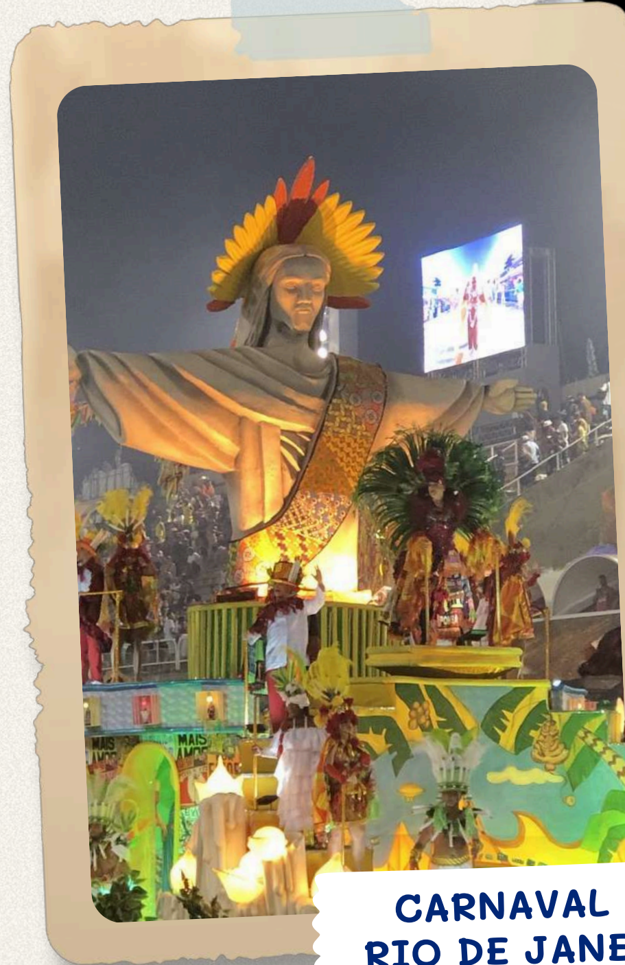
CARNAVAL DE RIO DE JANEIRO

Ne laissez pas passer cette chance incroyable de vivre le Carnaval de Rio en direct !